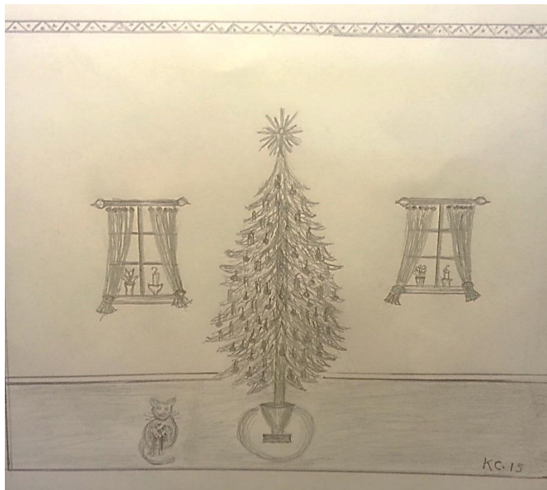
Text och bild: Karin Cederqvist

Kanske trevligt med ett omval Då får vi höra politikernas förbättringstal