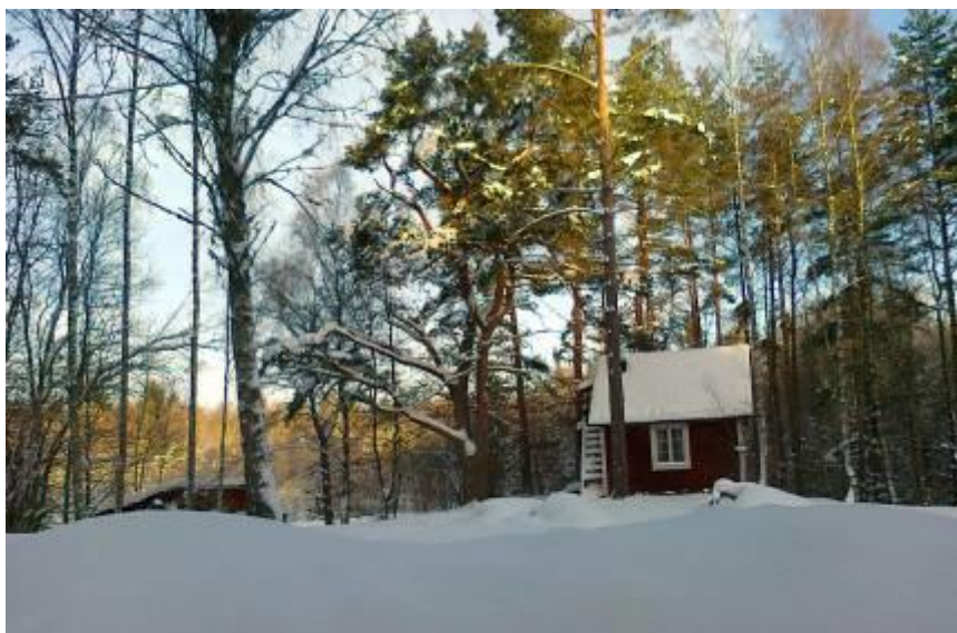
Axel Sjölanders hus. Nyårsafton