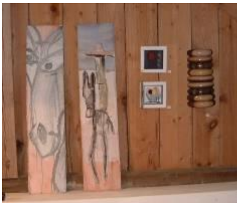
Här några verk gjorda av holländska och svenska kolleger från Tingsrydgruppens konstsymposium i våras