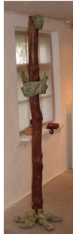
En av mina i brons och trä