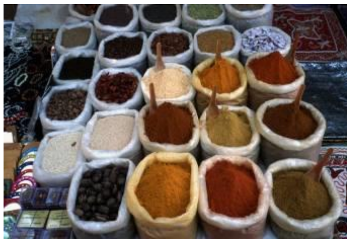
Kryddor i Indien

Grekerna och romarna dominerade kryddhandeln på 800-talet f. Kr. Troligen var romarna de första inom västvärlden som började att använda kryddor i maten och vinet. När man badade hällde man redan på den tiden aromatiska oljor i badvattnet.