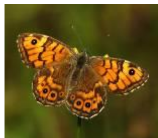
Svingelgräs- fjäril Argusvlinder