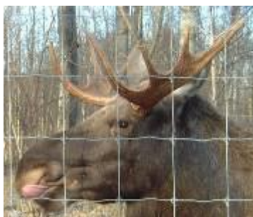
Älgtjurar gillar äpplen vilket korna inte gör