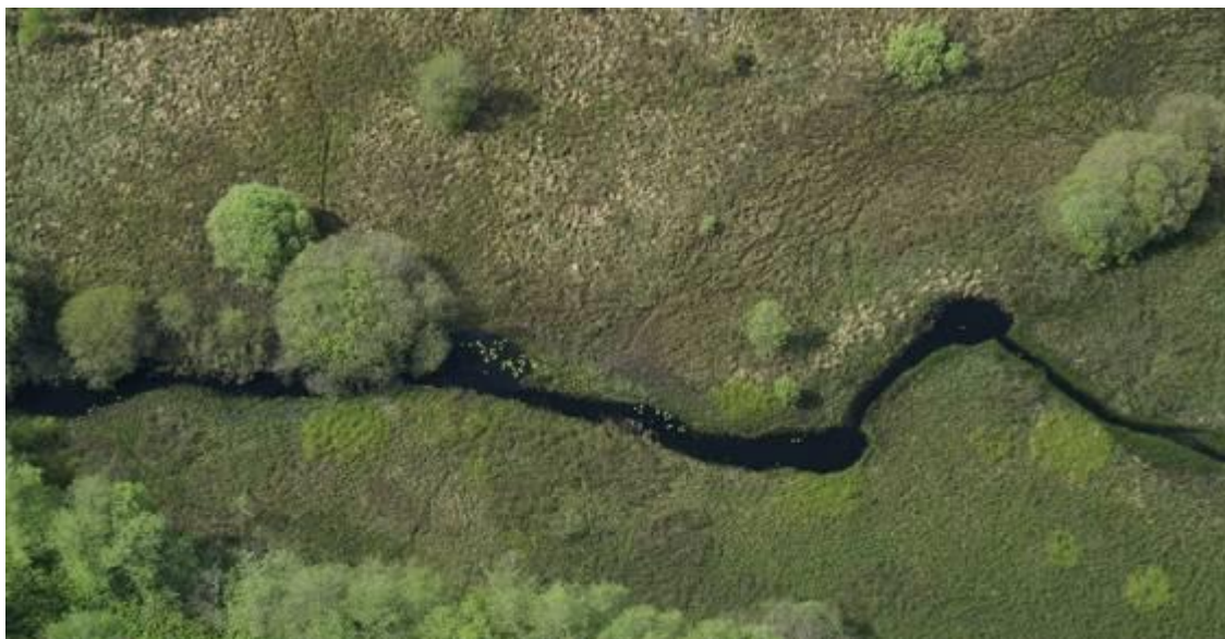
Drevån vid Miens norra ände.