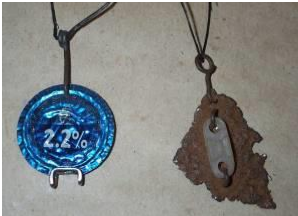
Ståltråd och kapsyl Rostig plåt och plastbit

Under en eller ett par kvällar i höst/vinter träffas vi som är intresserade och hjälper varandra att göra smycken och miniskulpturer av skrot.