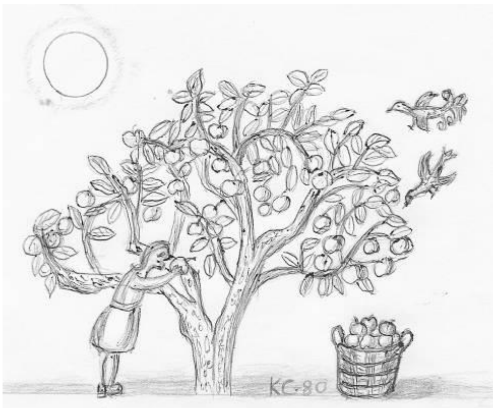
Karin Cederqvist (text och bild)

Doftande hölass dragen av ardennerhäst Tröskans brummande på logen, körd med vandring. Slåtterkalas, dragspelsmusik med dans. Skratt och glädje. Grannsämja. Sommar från en svunnen tid.