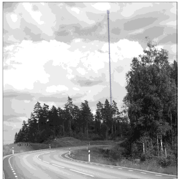
Från gamla 29:an. Ganska hög alltså, jämför med träden.