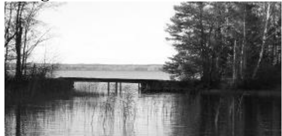
smyger sig ut mot ön..