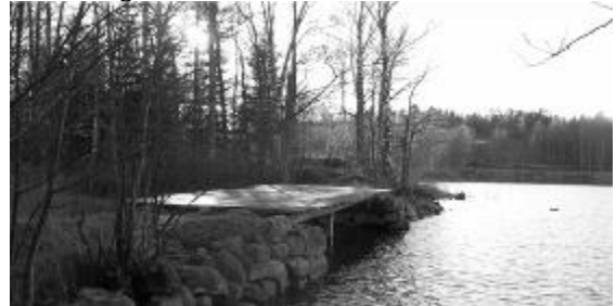
men vänder åter, inget att se. Är säsongen slut redan i november?