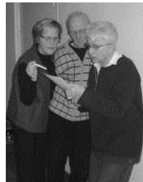
En hel del planering krävs...

Och vi som inte var med och städade återgäldar tacket till vaktmästarna. / Red.