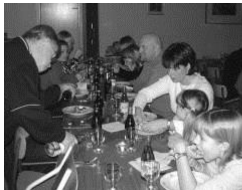
och det gäller att vara stadig på handen som vaktmästare