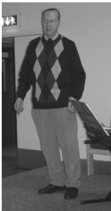
Bo i Knällsberg berättade