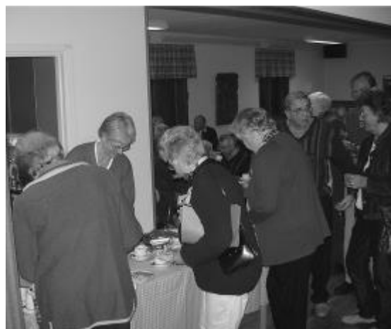
Och så fikad man så klart