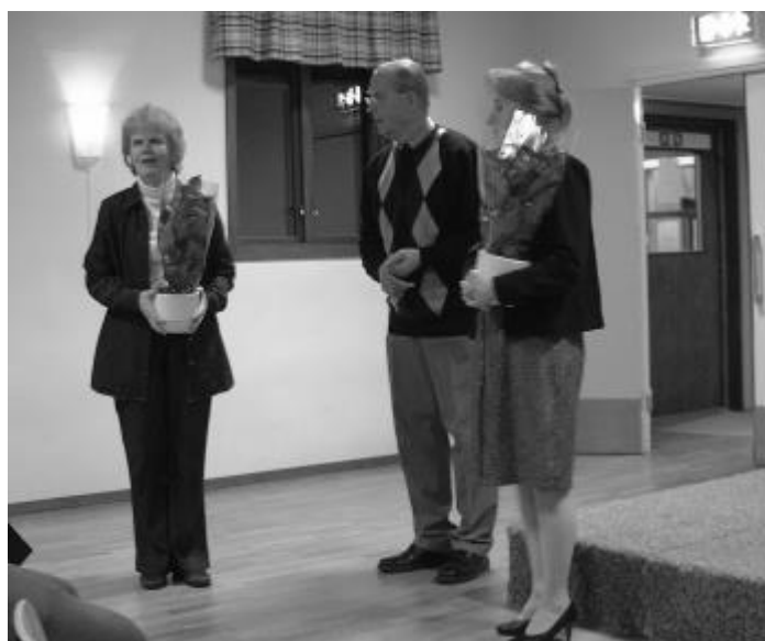
Gun delade ut blommor