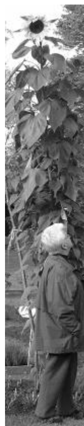
Eivor och solrosen 3,75 m

Manusstopp Mieninfo nr 1/04. Aktiviteter i mars , april och maj år 2004. Glöm ej att skicka in material. Vad som hänt och kommer att hända. Skriver du på dator: skicka då gärna på diskett eller e-post.