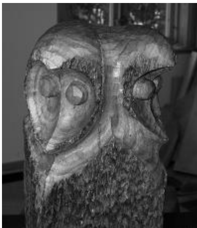
Fristående skulptur i sjödränkt ek

Även i skulpturerna får trästyckets form vanligen ge skulpturen dess form. Ofta konkavt skurna nästan polerade ytor i kontrast mot råa obearbetade ytor.